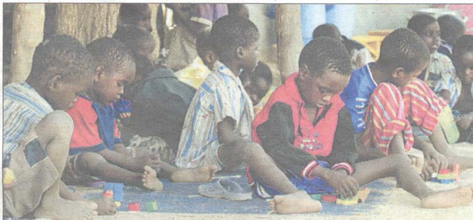
■ AFRICANI Ogni giorno decine migliaia di bambini muoiono per malattie facilmente curabili, violenze e fame.

WASHINGTON - Che la Cia, dopo l'11 settembre, usasse la "mano pesante" negli interrogatori dei presunti terroristi lo sapevano più o meno tutti. Ma adesso le rivelazioni del Washington Post sul fatto che nel 2005 l'intelligence distrusse le "imbarazzanti" registrazioni video dell'interrogatorio-tortura di Khalid Sheikh Mohammed (che ha confessato di essere stratega dell'11 settembre) e Abu Zubaydah (l'ex numero tre di Al Qaeda) sta mettendo nei guai anche i democratici. In particolare, rivela il quotidiano Usa, l'attuale "speaker" della Camera Nancy Pelosi partecipò, insieme ad altri membri del Congresso di entrambi gli schieramenti, a una trentina di briefing in cui la Cia spiegò le tecniche usate, compreso il contestato "waterboarding", l'annegamento simulato. Ma le polemiche non sono nuove. Vedi il caso del famigerato manuale "Kubark", redatto dalla Cia nel 1963 e desecretato nel 1997. (Crry)