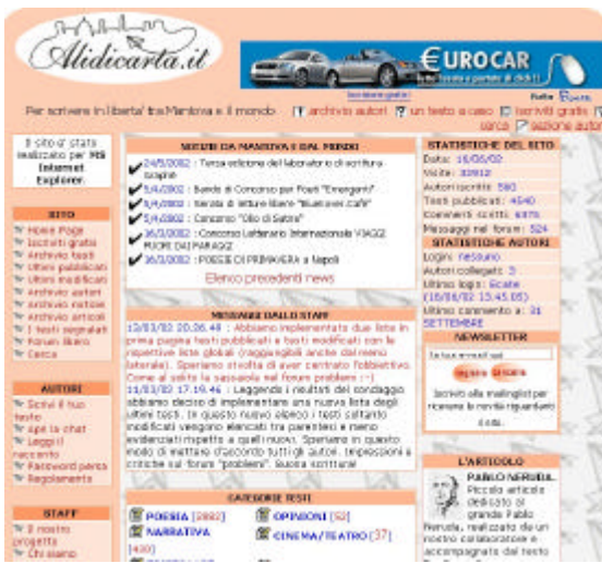
Home Page di www.alidicarta.it

In concreto, tali comunità funzionano sotto forma di newsgroup e mailing lists, anche se possono venireevolvemente implementate dalla presenza di un sito che preveda aree comuni ai membri della comunità. Un interessante caso di comunità virtuale ci viene fornito da Alidicarta.it, portale mantovano di letteratura i cui iscritti pubblicano gratuitamente le proprie poesie ed i racconti, possono intervenire all'interno di forum ed esprimere commenti circa le opere degli altri scrittori in erba. Anche le reti civiche talvolta possono espandersi e diventare veri e propri punti di ritrovo virtuali, fornendo ai cittadini la possibilità di poter discutere dei problemi concernenti la propria città, il caso più famoso in Italia è IperBole, la rete civica di Bologna.