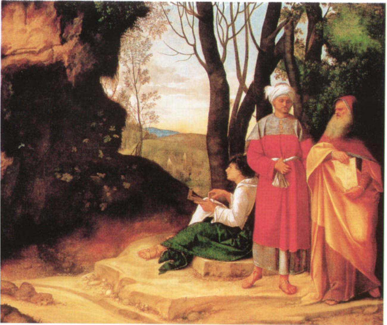
GIORGIONE, I tre Filosofi – 1508 ca., Vienna Kunsthistorisches Museum