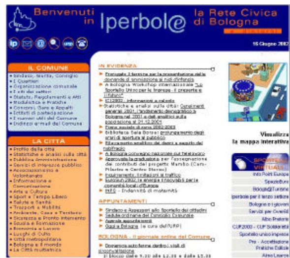
Home Page di www.comune.bologna.it

Un'altra esperienza di comunità virtuale (ma questa volta la rete è utilizzata ai fini del cosiddetto "Net Learning") è quella proposta nel '93 presso la Valdosta State University della Georgia: venne proposto all'università di svolgere un corso di filosofia solo ed esclusivamente attraverso internet. Il corso, durato dieci settimane, attivo 24 ore su 24, ha visto coinvolti 21 studenti sparsi in tutti gli USA, nel '96, quando il corso venne riproposto, i partecipanti era 111 e provenienti da tutti i continenti. Ogni settimana veniva assegnato un argomento da un tutor, che veniva poi rielaborato da parte di ogni studente tramite la creazione di pagine web, discussioni online, scambi di opinioni con gli altri partecipanti. Anch'io posso dire di aver preso parte ad una web community: in seguito alla competizione nazionale di fisica a Senigallia, i partecipanti hanno dato vita ad una vera e propria comunità online, i cui membri si scrivono frequentemente per scambiarsi opinioni, ma non lo fanno in forma privata, bensì coinvolgendo tutti gli iscritti: così, le discussioni portano alla luce una miriade di punti di vista e di interpretazioni dello stesso fenomeno,